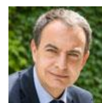
JOSÉ LUIS RODRÍGUEZ ZAPATERO Expresidente del Gobierno de España 14/10/2015